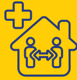
Centro de Atención Psicosocial