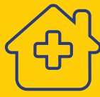
Centro de salud