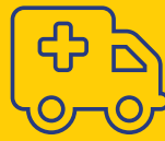
Servicio de emergencia